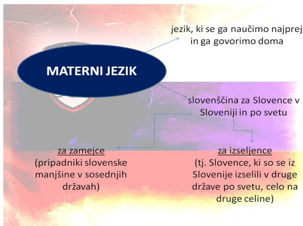
Slika: PPT predstavitev od KATJA MAJHEN 8. C, urednica časopisa KAJUHOVC