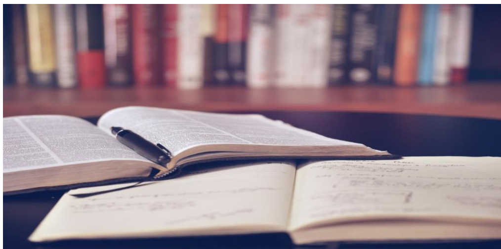
Slika: https://unsplash.com/s/photos/study (izbrala NIKA OGRIN)