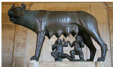
Slavna plastika je danes na ogled v Musei Capitolini v Rimu.