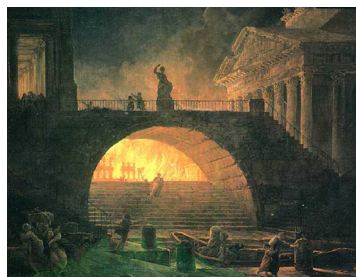
Na sliki Huberta Roberta je upodobljen veliki požar v Rimu leta 64.

je rimske države po dolгих letih republike znova prevzel en sam človek. Rimski teritorij, sestavljen iz Italije in več provinc, je bil v tem času razširjen že po vsem Sredozemlju. Avgust je razvil sistem vodenja tega velikega ozemlja na način, ki je prinesel dolgotrajen mir in blagostanje.