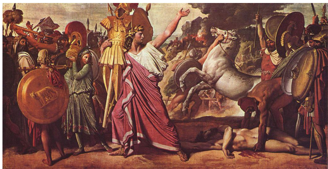
Prva rimska zmaga. Slika je naslikal znani francoski slikar Jean Auguste Dominique Ingres leta 1812.

in skrbela zanju. Ko sta dečka odrasla, sta se maščevala kralju Amuliju, ga vrgla s prestola in oblast vrnila svojemu dedu. Sama pa sta ustanovila svoje mesto ob reki Tiberi, ki je dobilo ime Roma – Rim.