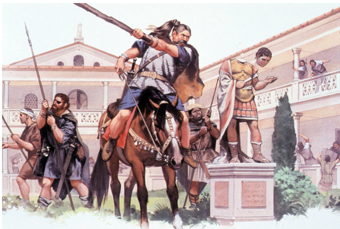
Vandali oplenijo mesto Rim leta 455.

1 18 5 7 obseg. Imel je okoli 60 milijonov prebivalcev, ki so živeli na 5 milijonih kvadratnih kilometrov. Raztezal se je od Škotske na severu do Egipta na jugu, od Maroka na zahodu do Iraka na vzhodu. Cesar Dioklecijan pa je bil tisti, ki je skoraj 200 let kasneje imperij razdelil na zahodni in vzhodni del, da bi mu tako lažje vladal. Ta razdelitev je pomembno vplivala na kasnejšo zgodovino Evrope. Takrat zastavljena meja je zaznavna še danes, saj predstavlja mejo med katoliškimi in pravoslavnimi kristjani.