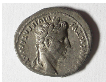
Avgust, upodobljen na novcu.

. V tem času so Rimljani razširili svojo oblast po vsem Apeninskem polotoku in kasneje po Sredozemlju. V času rimske republike se je rimski vpliv širil tudi na ozemlje današnje Slovenije.