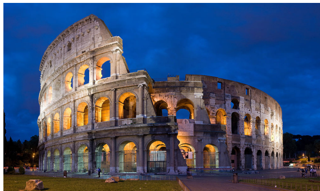
Kolosej – veliki amfiteater, ki ga je dal zgraditi cesar Vespazijan v Rimu. Foto: David Illiff. Licenca: CC-BY-SA 3.0. Vir: http://en.wikipedia.org .

V 3. stoletju se je rimski imperij soočil s težavami, ki so resno ogrozile njegov obstoj. Tako ogromno državo je bilo težko upravljati, slabšala se je komunikacija med posameznimi deli imperija, vojska se je pogosto upirala in postavljala svoje cesarje, gospodarstvo je pešalo. Veliko težavo so pomenili vdori 1 14 1 14 7 ljudstev preko meja cesarstva. Skratka, v času med 4. in 6. stoletjem je rimski imperij počasi razpadal. Dioklecijanova delitev imperija na dva dela je težave rešila le začasno. Leta 476 je bil odstavljen zadnji zahodnorimski cesar. Ta letnica velja za datum konca zahodnega rimskega imperija, medtem ko je vzhodni rimski imperij preživel še vrsto stoletij kot bizantinsko cesarstvo.