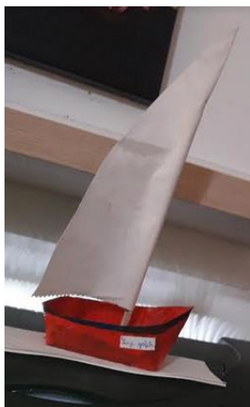
Izdelala: Lana Jutriša