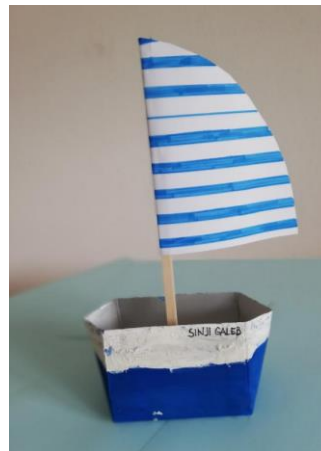
Izdelal: Marcel Melanšek

Ta teden je naša učna snov povezana z vijoličnim delovnim zvezkom, tem: