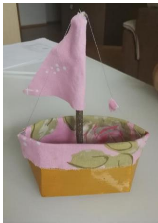
Izdelala: Neja Mraz

Hvala vam za vse poslane slike vaših barčic in pisem, učitelji smo vaše barčice z veseljem občudovali, v vaših pismih pa so se lesketali biseri slovenske pisane besede!