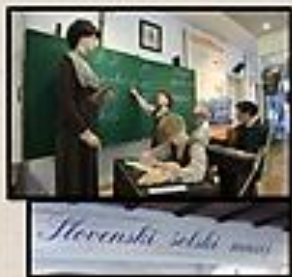
Slovenski šolski muzej