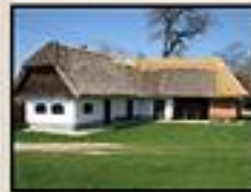
MUZEJ NA PROSTEM PIETERJE