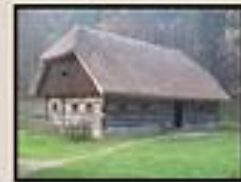
Muzej na prostem Pieterje