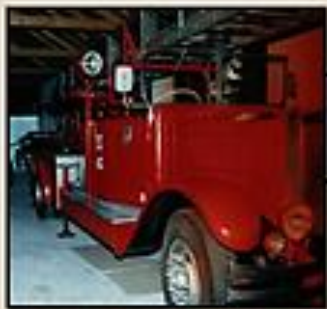
ŠLOVENSKI GASILSKI MUZEJ