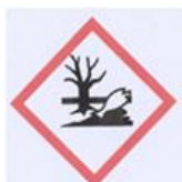
nevarno za vodno okolje