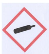
plini pod tlakom