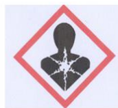
specifično strupeno (rakotvorno, mutageno)