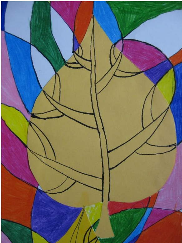
Naja Rednak, 5.b