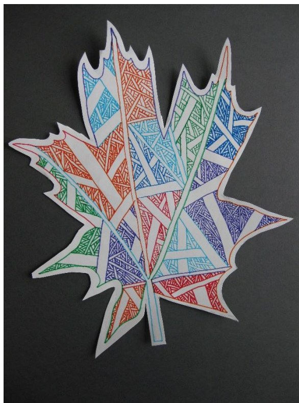
Urša Sevčnikar, 5.b