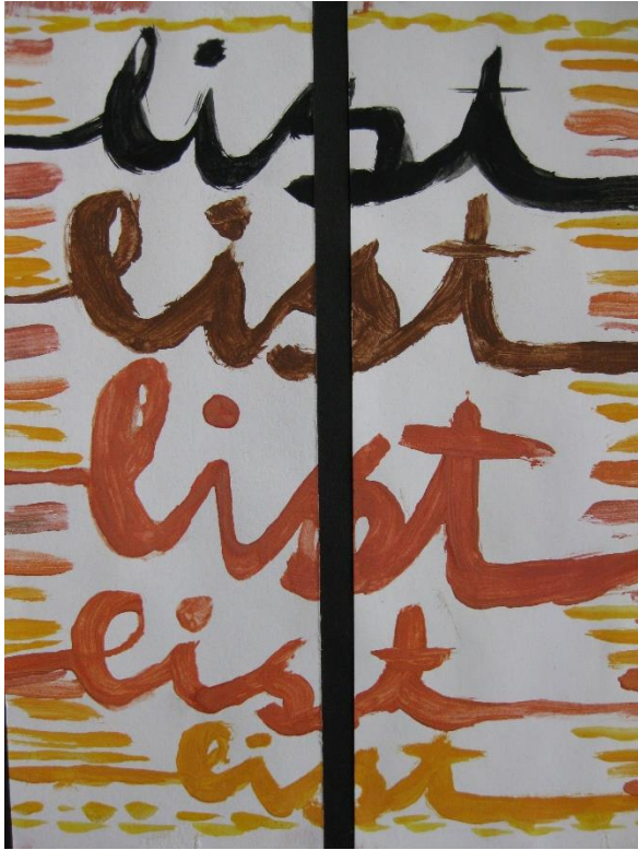
Polona Mežnar, 8.c