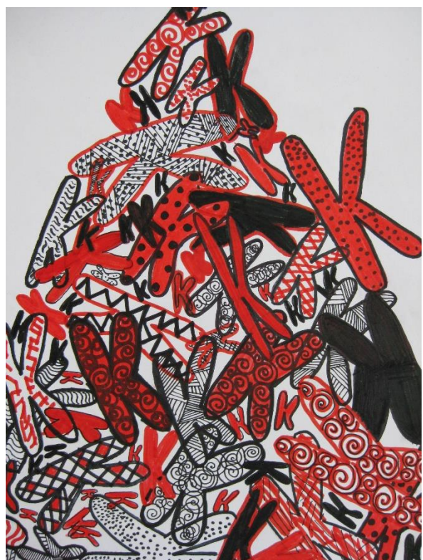
Nejla Cerić, 7.a