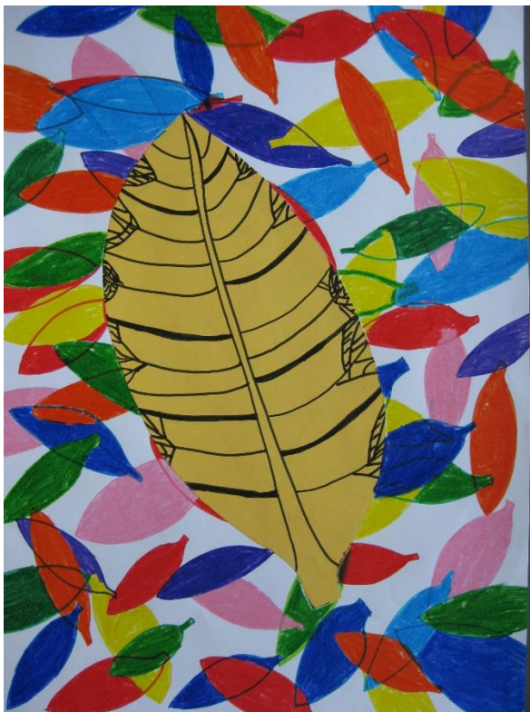
Naja Rednak, 5.b