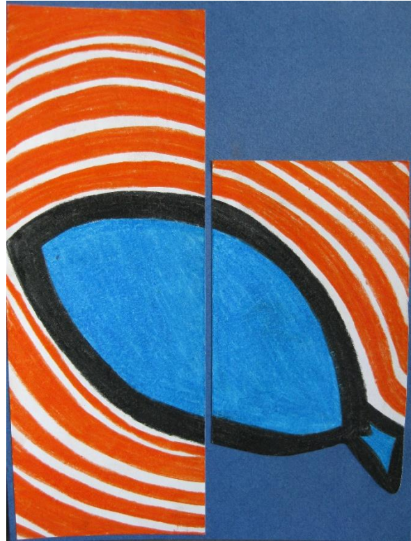
Lara Bačovnik, 8.a