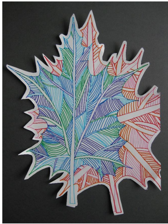
Teja Krk, 5.b